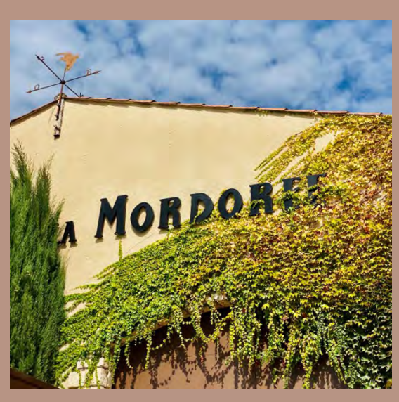
The winery in Tavel