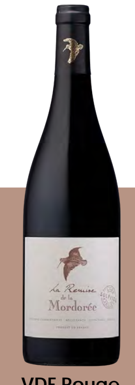
VDF Rouge La Remise SSA