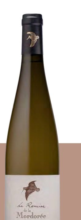
VDF Blanc La Remise