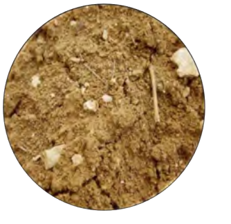
Type of soils

White Grape Varieties: Clairette and Viognier